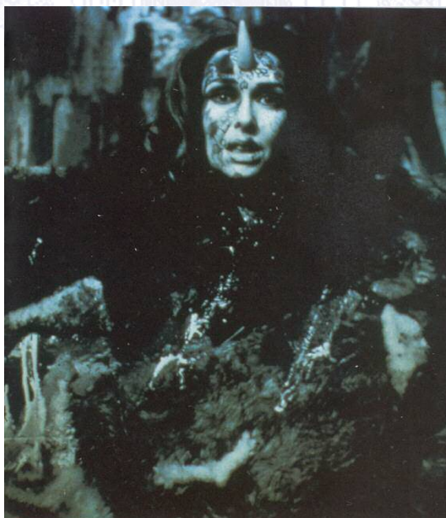
Carolee Schneemann: Eye body:36 . Transformative Actions. 1963 New York

En la década de los setenta se produce un movimiento artístico en Estados Unidos y Europa encuadrable dentro de la corriente feminista, en el que artistas como Orlan, Abramovic o Judy Chicago 6 denuncian el papel de la mujer mediante performances, medio idóneo para contestar y cuestionar construcciones arquetípicas del cuerpo femenino y denunciar problemas relacionados con el género. Marina Abramovic trabaja con el dolor