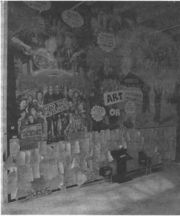
13.1 Navin Rawanchaikul, Super (M)art , 2000. Instalación de varios medios, Palais de Tokyo, París.

ciones líricas y melancólicas que se dedicaron a este estado aparentemente “posthistórico” (y una de las tantas que ofrecía el arte como respuesta, o al menos solaz, a tal inquietud). Esta situación fue considerada el eje de su época por algunos teóricos, en particular Francis Fukuyama (1992). Sin embargo, vista desde la perspectiva actual, se trata de una particular conjunción entre historicismo e ingenuidad de tábula rasa que resulta bastante típica y mistificadora. Antes que una duda profunda y provocadora acerca de la práctica de la periodización, se transformó en una duda acerca de la eficacia del propio pensamiento histórico.