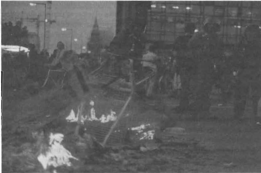
13.4 Josephine Meckseper, Untitled (Demonstration, Berlin) [ Sin título (Manifestación, Berlín) ], 2001. Fotografía a color. (© 2008 ARS, NY/VG Bild-Kunst, Bonn.)